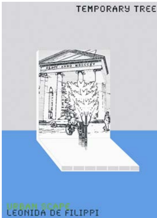
TEMPORARY TREES un progetto di Sotirios Papadopoulos in collaborazione con lo Studio Nicolussi e Flash crafts Vicenza, cortili centro storico