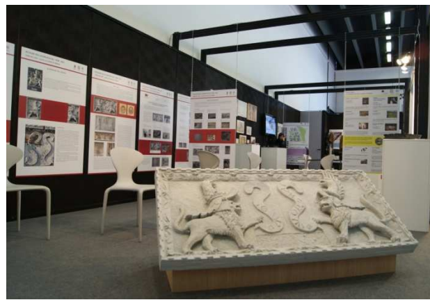
Comune e Provincia di Ferrara