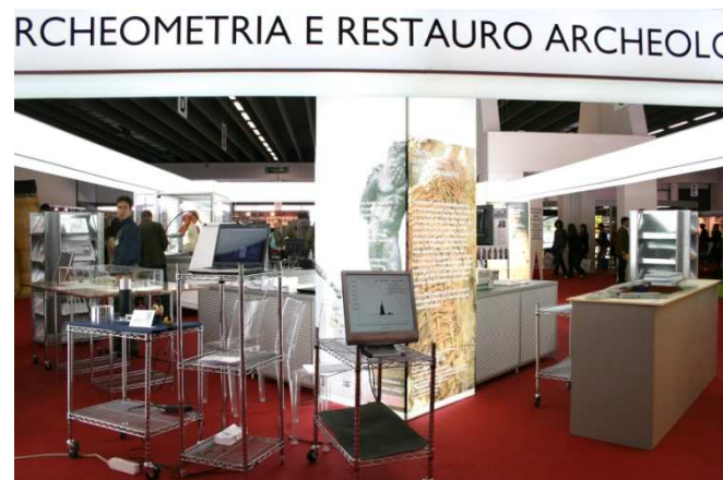
Regione Toscana - Progetto Archeomed