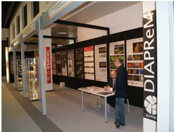
DIAPReM Univ.Fe - Fac. Architettura