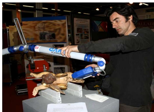
Cam2 - Gruppo Faro