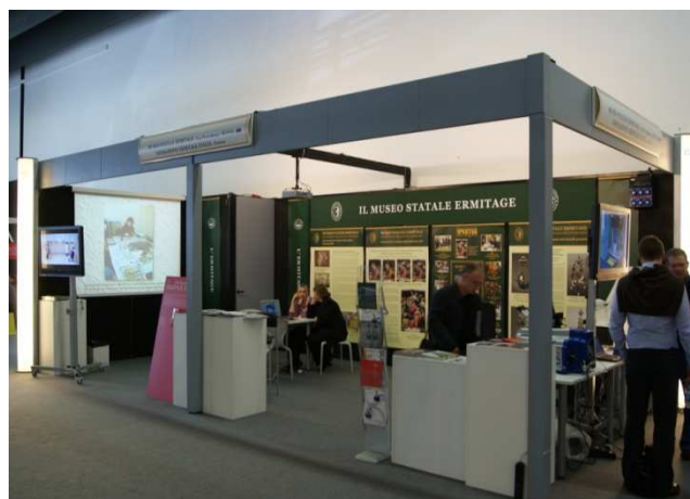
Museo Statale dell'Ermitage