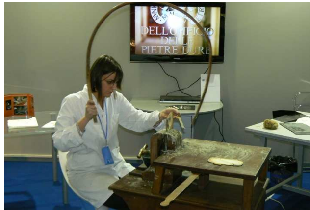
Opificio delle Pietre Dure