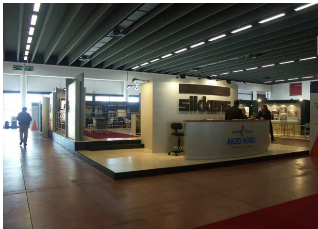
Akzo Nobel Sikkens