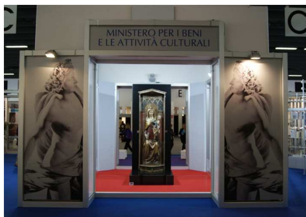
Ministero per i Beni e le Attività Culturali