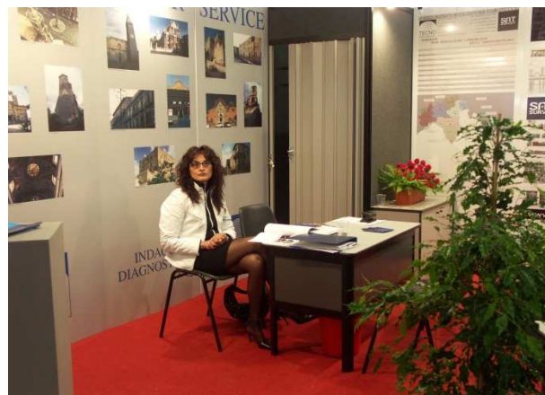
Tecno Futur Service