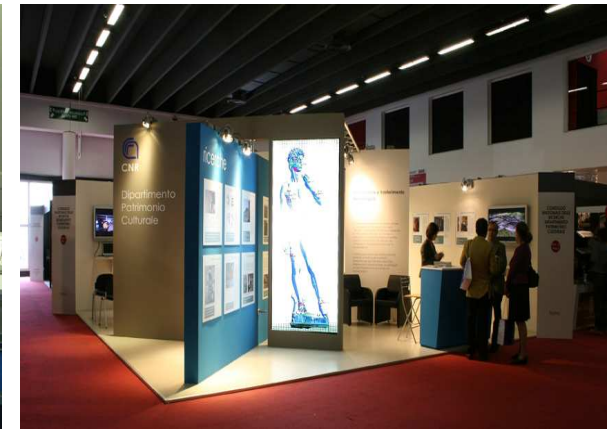
CNR Consiglio Naz.le Ricerche