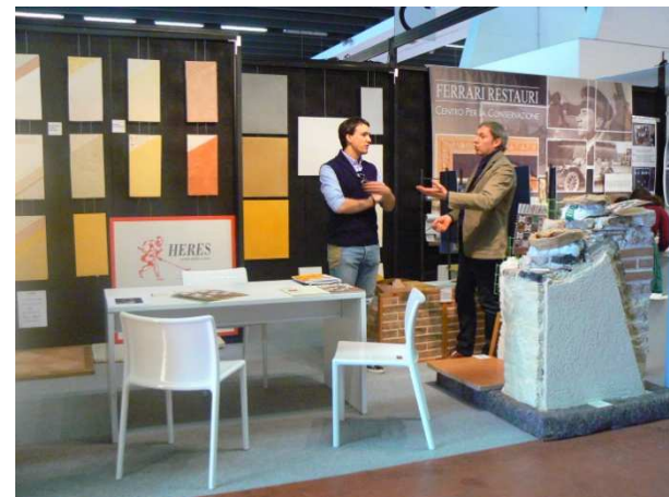
Centro Ferrari Restauri