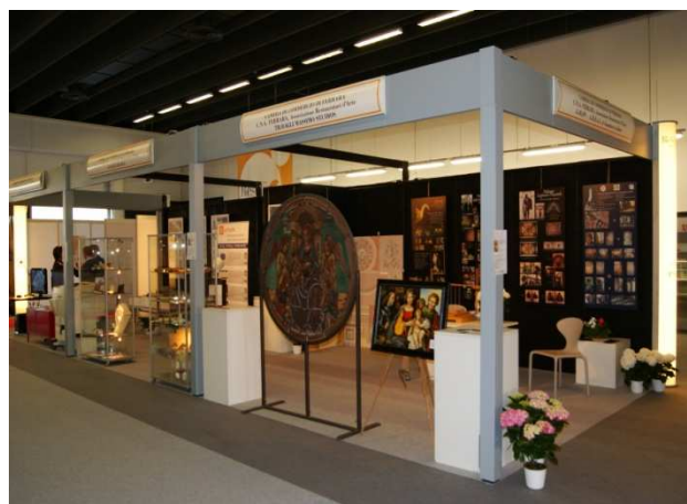
Camera di Commercio di Ferrara