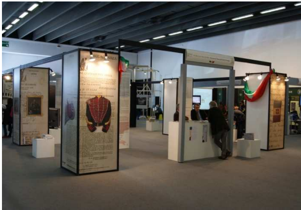
IBACN Regione Emilia Romagna