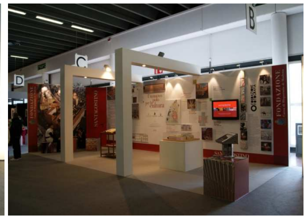
Fondazione Cassa di Risparmio di Modena